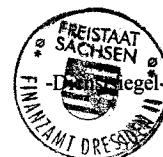
Beate Langguth Sachbearbeiterin

Hausanschrift Finanzamt Dresden II Rabenerstraße 1 01069 Dresden